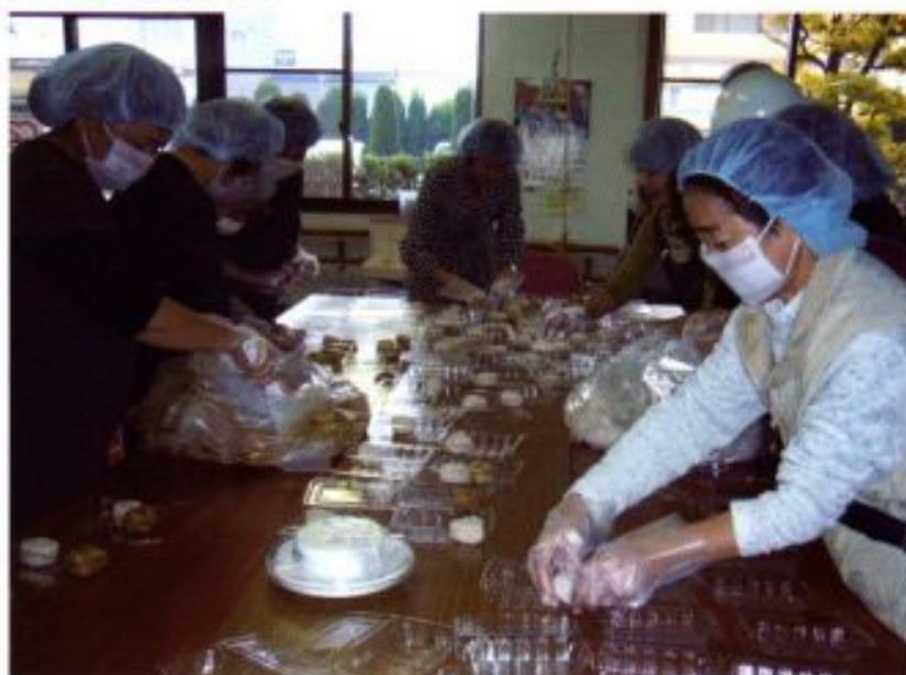
火を使わず水だけで出来る不思議なお米のおにぎり