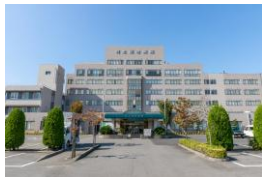
回復期リハビリ病棟